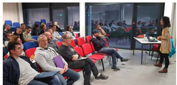
Présentation des aides financières à la rénovation destinée aux professionnels membres de la CAPEB.